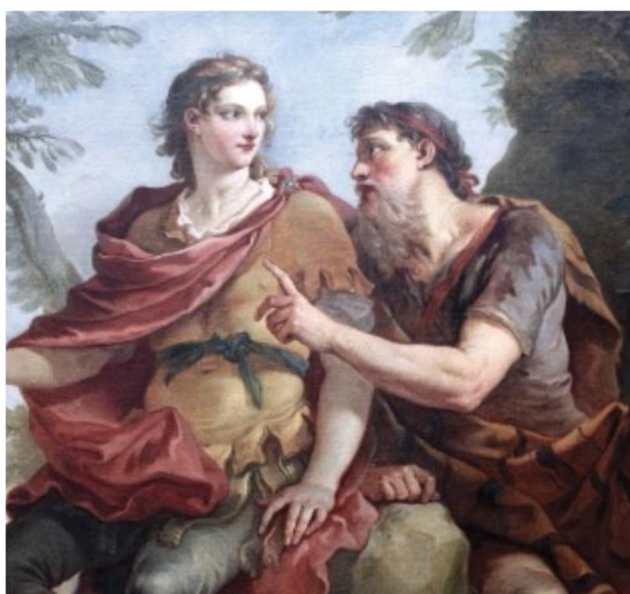
Charles-Joseph Natoire, Télémaque écoutant les conseils de Mentor , 1740. La scena visualizza la ricezione moderna del motivo omerico di Atena che guida Telemaco sotto sembianze umane, all'origine della successiva trasmissione semantica del lemma «mentore»

Il primo dato va affermato con assoluta nettezza: «mentore» non appartiene né al lessico biblico né alla semantica del Nuovo Testamento. La sua origine è extrabiblica e, più precisamente, omerica. Il vocabolo moderno rinvia infatti al greco Μέντωρ ( Méntōr ), nome proprio di un personaggio dell' Odissea : l'amico di Odisseo al quale l'eroe, partendo per Troia, affida la casa, la famiglia e la custodia del giovane Telemaco 1 . Ma il punto decisivo è un altro: nel poema, la funzione di consiglio, accompagnamento e impulso formativo associata a quel nome non deriva soltanto dal personaggio umano in quanto tale. Se nel libro I Atena interviene anzitutto sotto le sembianze di Mente, già nella Telemachia essa assume anche quelle di Mentor, orientando Telemaco, scuotendolo dall'inazione e guidandolo nel cammino; e il medesimo travestimento ricompare più avanti, sino al quadro finale del poema. Non siamo dunque dinanzi alla semplice presenza di un consigliere fidato, ma a una struttura narrativa nella quale Atena — dea olimpica della sapienza strategica, del consiglio e della guerra accorta — opera sotto volto umano per dirigere un itinerario. È precisamente questa compenetrazione fra figura umana e intervento divino a impedire che il nome possa essere banalmente assunto come sinonimo neutro di «guida».